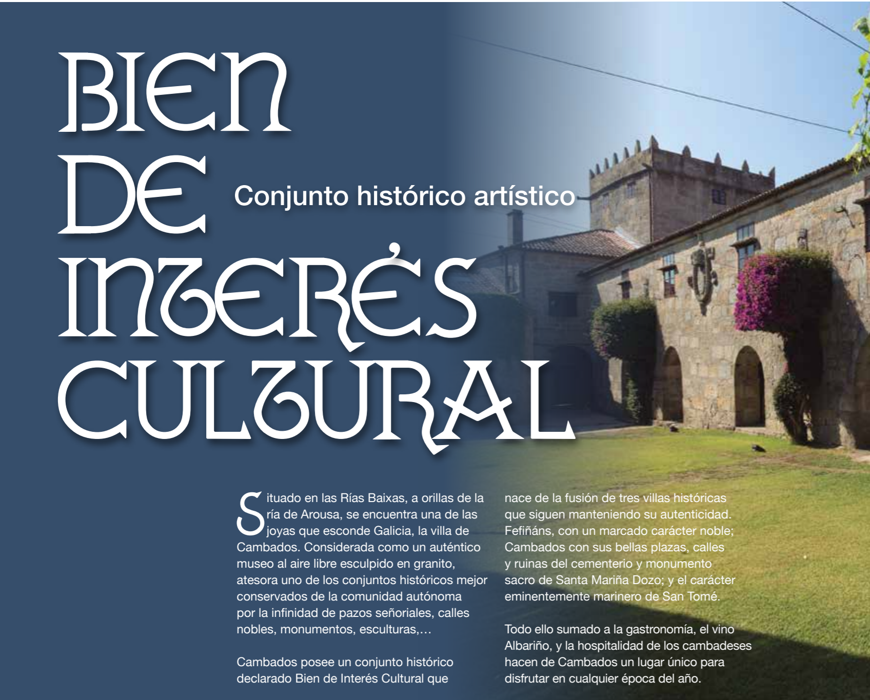
Arco del Pazo de Fefiñáns